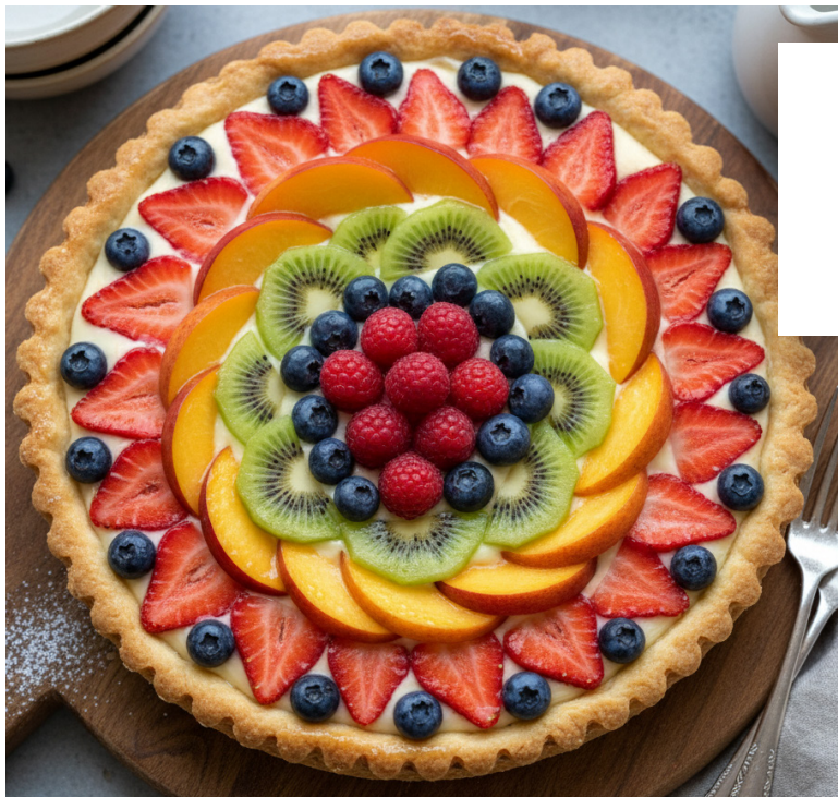
Crostata di frutta fresca per 30 persone 180 euro