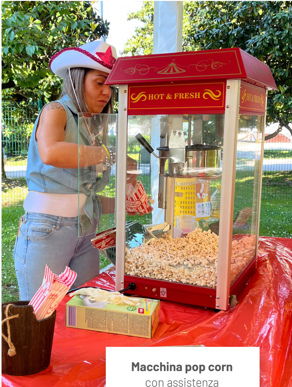
Macchina pop corn con assistenza persona HACCP 250 euro