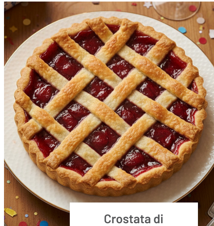
Crostata di marmellata per 30 persone 120 euro (ogni porzione extra € 3,00)