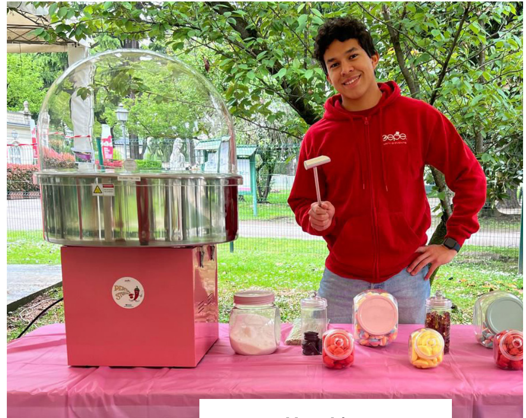
Macchina per zucchero filato con assistenza persona HACCP 200 euro